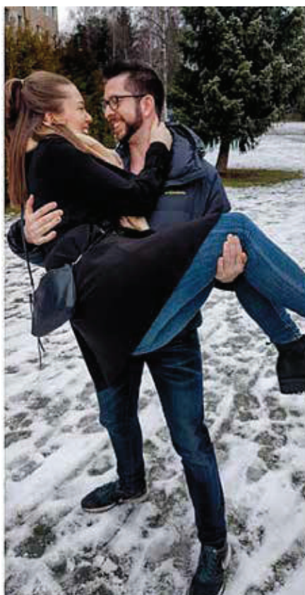
DISSE BILDENE BLE tatt dagen før vi reiste på vinterferie

fordi han ser såpass skadet ut. Når jeg går ved siden av ham tror de fleste at jeg er assistenten hans. Dette er fordi mine skader nesten ikke er synlige, til tross for at jeg fikk en av de mest alvorlige hodeskadene du kan få. Av og til glemmer jeg selv at jeg er syk, og overanstrenger meg, fordi jeg ser så frisk ut. Jeg føler at andre synes at jeg var heldig. Det var jeg óg, men sannheten er at jeg jobber beinhardt, hver bidige dag. Dette gjelder kanskje også deg som har hatt slag? Eller